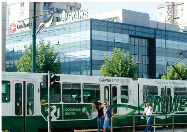
Direkcija GRAWE osiguranja u Sarajevu, BiH